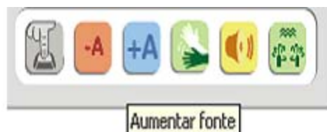
FIGURA 3 - Etiquetagem para conteúdo não-textual.

Princípio 2 - Operável - Os componentes de interface de usuário e a navegação devem ser operáveis. Aplicação do princípio: (a) todos os recursos e as funcionalidades do ADA/AVA Eduquito estão disponíveis para acesso pelo teclado, e o usuário é orientado sobre como utilizar as teclas de atalho nas diferentes versões de navegadores para Web.