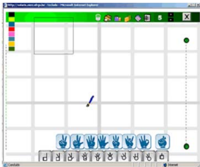
FIGURA 4 - Teclado virtual para a escrita de sinais.

O estudo realizado por Barth (2008) apontou para o potencial de ações sociocognitivas mediadas pelo teclado virtual para a escrita em língua de sinais no processo de construção da leitura e da escrita de crianças surdas. O teclado virtual de escrita da língua dos sinais configura-se como mais um recurso de TA para promover a interação e a comunicação entre os usuários no ambiente. A relevância do teclado virtual é atestada pela possibilidade de apoiar a comunicação entre os usuários, permitindo a troca de mensagens por meio do correio eletrônico, ação que ilustra o princípio de intratextualidade do ambiente, por permitir a conexão com outras ferramentas dentro do Eduquito.