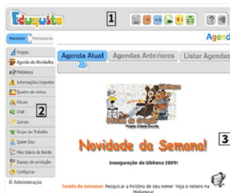
FIGURA 2 - Interface principal do ADA/AVA Eduquito.

Os quatro princípios - perceptível , operável , compreensível e robusto -, estabelecidos nas recomendações de acessibilidade da WCAG 2.0, orientaram a modelagem de interface acessível: